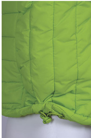
Dettaglio cordone regolabile con freno in fondo