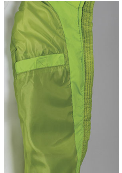
Dettaglio tasca interna in petto a sinistra