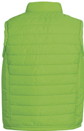
Vista posteriore del capo